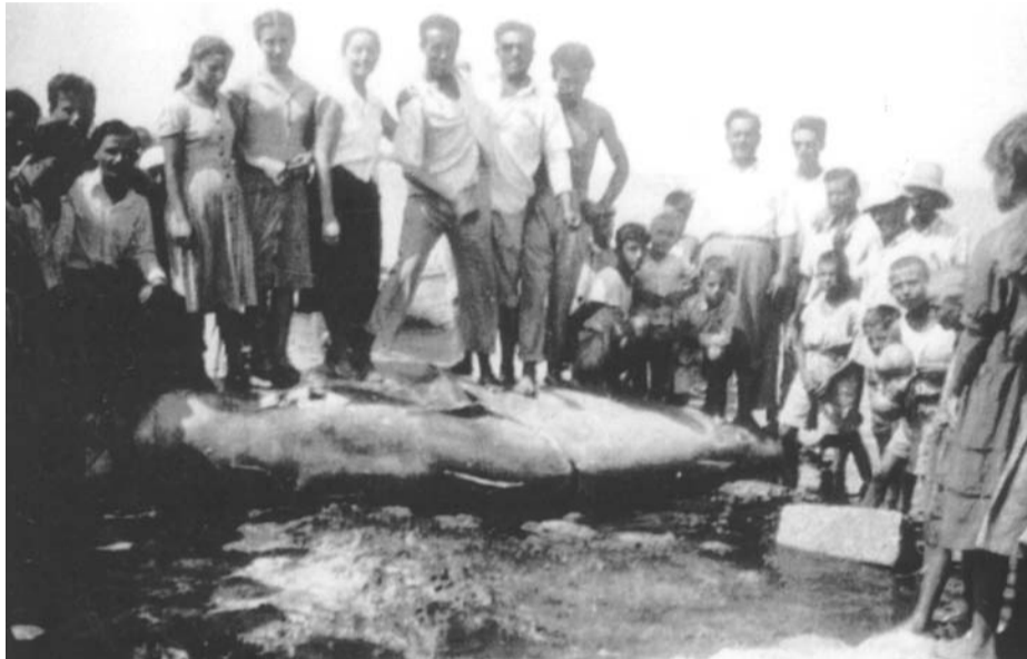
Αυτό το κίτος βγήκε στην Πούντα, και τόφεραν οι κουμογιανναίοι στο Λαφονήσι να το κάνουν ψάδι της μπογιάς. Δεν έγινε τίποτα. Εθαφόνησος 1958