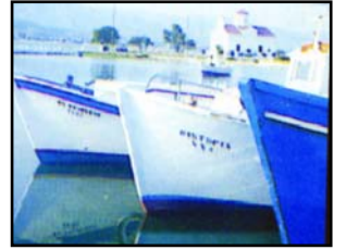
Άγ. Σπυρίδων - Λιμάνι

ΔΙΜΗΝΙΑΙΑ ΕΦΗΜΕΡΙΔΑ ΤΟΥ ΣΥΛΛΟΓΟΥ ΕΛΑΦΟΝΗΣΙΩΤΩΝ ΑΘΗΝΑΣ - ΠΕΙΡΑΙΑ «Ο ΦΙΛΟΠΑΤΡΙΣ»