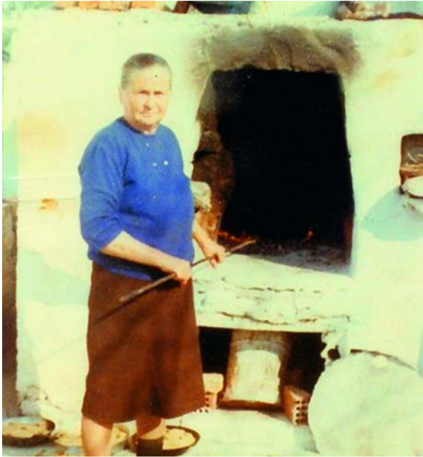
1975 Παραμονή Πρωτοχρονιάς