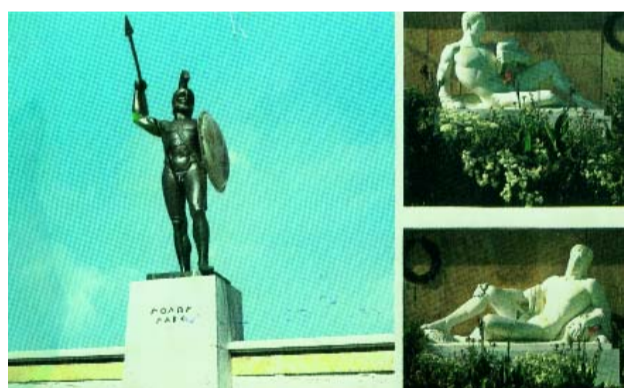
Ο ΛΕΩΝΙΔΑΣ ΣΤΙΣ ΘΕΡΜΟΠΥΛΕΣ Η μάχη έγινε το 480 π.Χ. Αύγουστος 1972 - Τζ. Πασσάκος