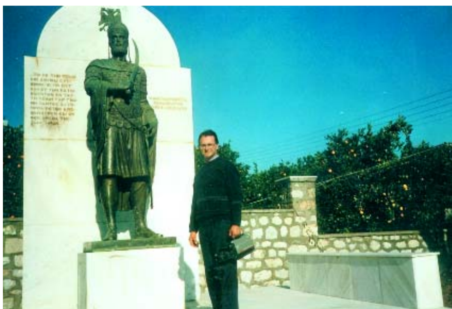
ΜΥΣΤΡΑΣ ΚΩΝΣΤΑΝΤΙΝΟΣ ΠΑΛΑΙΟΛΟΓΟΣ

Έπεσε πολεμώντας στην Κωνσταντινούπολη στις 29/5/1453. Ήταν ο τελευταίος Αυτοκράτορας του Βυζαντίου 1404 - 29/5/1453 όταν έπεσε, ήταν 49 χρονών.