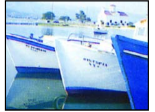
Άγ. Σπυρίδων - Λιμάνι

ΔΙΜΗΝΙΑΙΑ ΕΦΗΜΕΡΙΔΑ ΤΟΥ ΣΥΛΛΟΓΟΥ ΕΛΑΦΟΝΗΣΙΩΤΩΝ ΑΘΗΝΑΣ - ΠΕΙΡΑΙΑ «Ο ΦΙΛΟΠΑΤΡΙΣ»